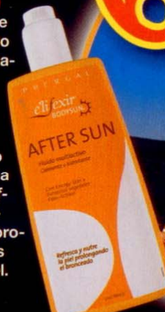
Aftersun "Elifexir Body Sun" (Phergal, 13,50 €).

No hace falta que te pongas como un cangrejo para acordarte de ese simpático crustáceo. A la primera rojez o incluso si simplemente has pasado muchas horas frente a "lorenzo", aplícate aftersun , porque, además de hidratar en profundidad, renueva las células y calma la piel.