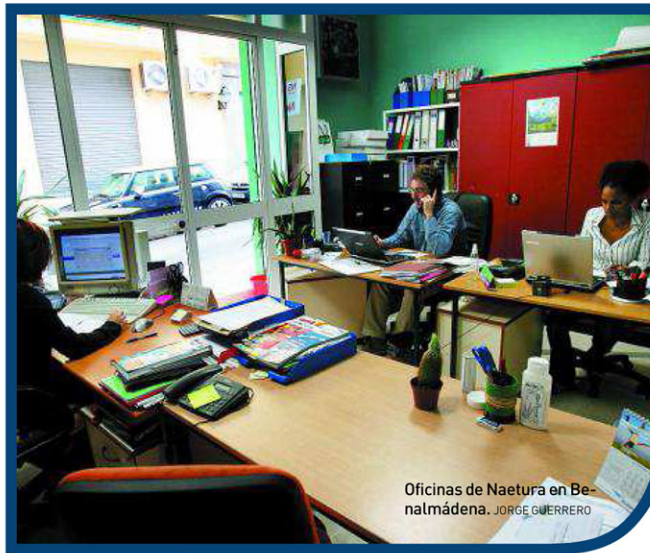
Oficinas de Naetura en Benalmádena. JORGE GUERRERO

A día de hoy, siete años después del nacimiento, Naetura cuenta ya con tres trabajadores en el equipo comercial, dos técnicos y dos administrativos. En estos años se ha producido una mayor sensibilización hacia los productos naturales al tiempo que crece el rechazo a los ingredientes sintéticos y de origen animal. "Los productos se dirigen a todo tipo de público, ya que cada vez es más generalizado el consumo de productos de cuidado personal", destaca García. El