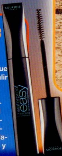
Máscara "Waterproof Easy" (Bourjois, 13,35 €).

Eres de las que no saben salir de casa sin pintarse la pestaña? Pues ahora puedes tener una mirada seductora ¡hasta en el bordillo de la pisci! Los productos waterproof han conseguido que agua y maquillaje de ojos hagan las paces, y nosotras ¡felices!