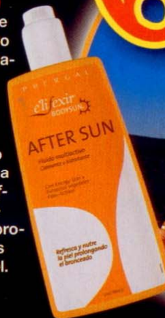
Aftersun 'Elifexir Body Sun' (Phergal, 13,50 €).

No hace falta que te pongas como un cangrejo para acordarte de ese simpático crustáceo. A la primera rojez o incluso si simplemente has pasado muchas horas frente a "lorenzo", aplícate aftersun , porque, además de hidratar en profundidad, renueva las células y calma la piel.