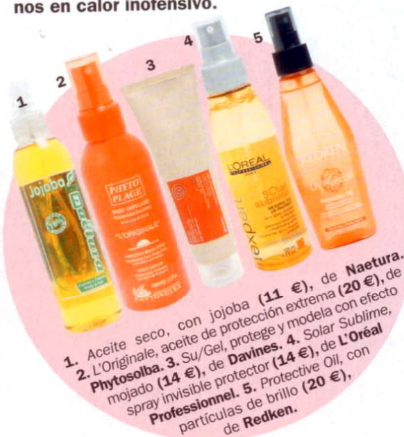
1. Aceite seco, con jojoba (11 €), de Naetura. 2. L'Originale, aceite de protección extrema (20 €), de Phytosolba. 3. Su/Gel, protege y modela con efecto mojado (14 €), de Davines. 4. Solar Sublime, spray invisible protector (14 €), de L'Oréal Professionnel. 5. Protective Oil, con partículas de brillo (20 €), de Redken.

NO TE PIERDAS: los productos formulados con el filtro Mexoryl S.O. que L'Oréal ya utilizaba para la piel, y ahora ha reformulado para atender las necesidades del pelo: transforma los rayos dañinos en calor inofensivo.