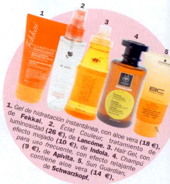
1. Gel de hidratación instantánea, con aloe vera (18 €), de Fekkai. 2. Éclat Couleur, tratamiento de luminosidad (26 €), de Lancôme. 3. Hair Gel, con efecto mojado (10 €), de Indola. 4. Champú para uso frecuente, con efecto relajante (9 €), de Apivita. 5. Sun Guardian, contiene aloe vera (14 €), de Schwarzkopf.