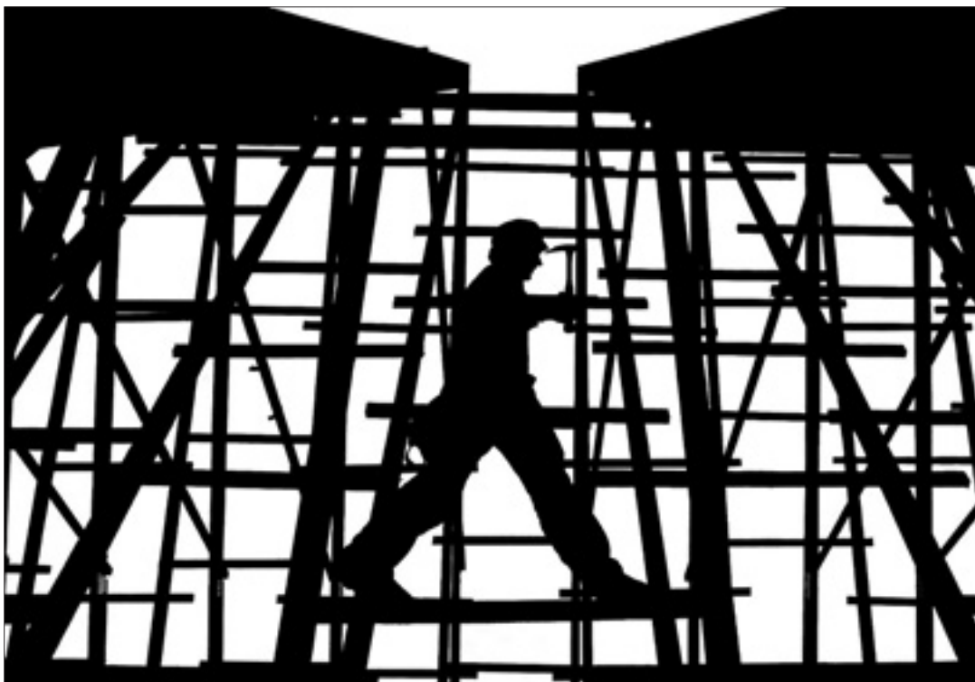
Perfil. La construcción es la mayor responsable del 'boom' de sociedades que vive Málaga: una sociedad por cada nueva obra. L. 0

La ratio de Málaga supera la media andaluza y española